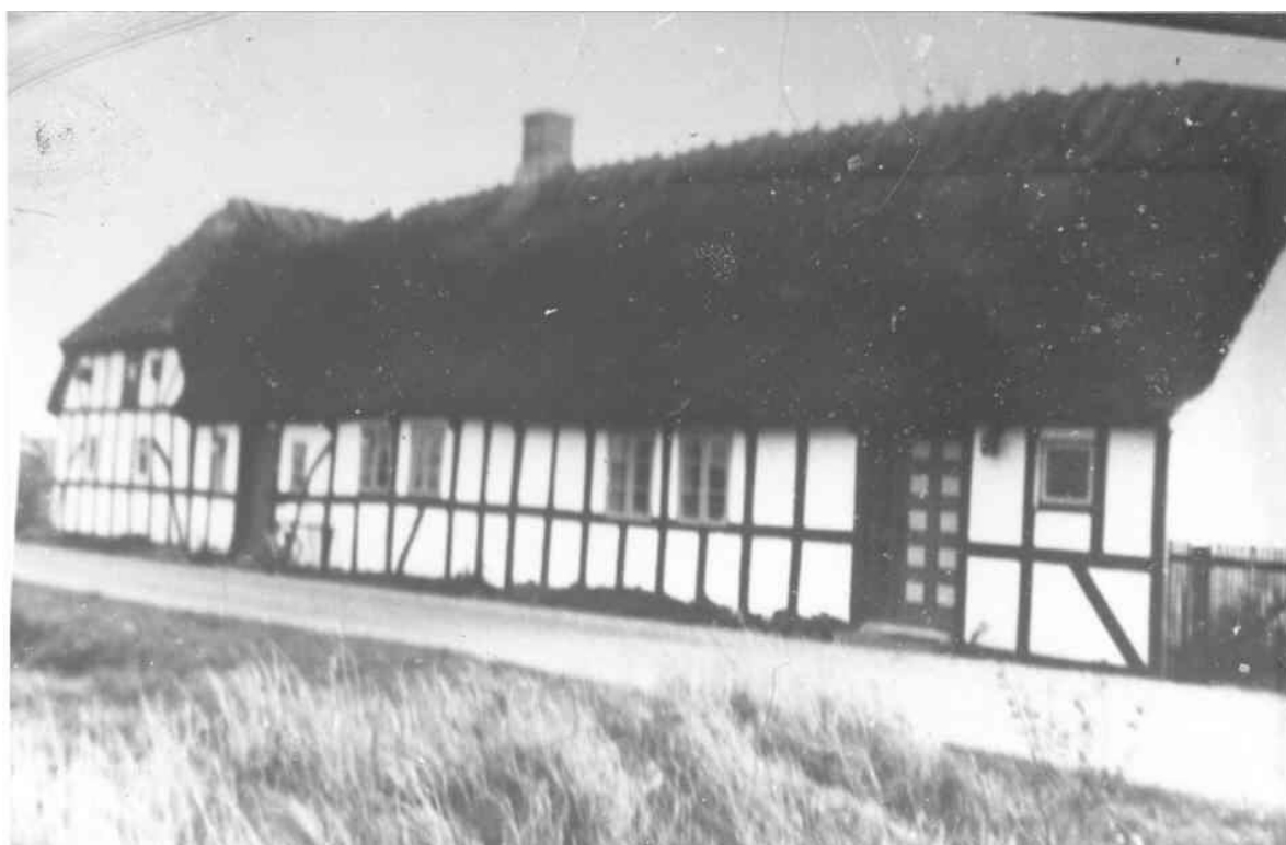
Bækkevej 8 ca. 1960. Huset blev bygget i 1809