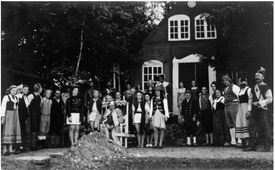
Molboerne. Stykket blev spillet på sportspladsen, men vi har ikke kunnet identificere personerne