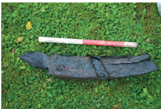
Rest af møllehjul