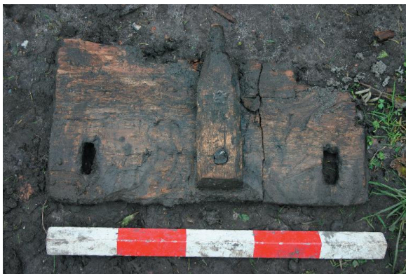
Mølleblad fundet ved Rolfsted Vandmølle.

Af fund fremkom bl. a. en massiv fodrem, der antagelig har holdt mølletruget, en langtandskam, dele af et flækket enkeltringet møllehjul, et muligt stykke af et tandhjul, et helt mølleblad plus et fragment af et sådant.