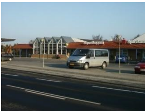
Ved Ferritslev Brugs

Lørdag d. 1-9-07 deltog vi i foreningsmessen ved Ferritslev Brugs, hvor vi havde en stand. Der blev vist en god interesse for standen, hvor vi viste nogle billeder m.m. frem