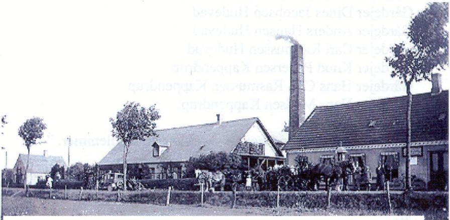
Rolfsted Mejeris jubilæum 1938