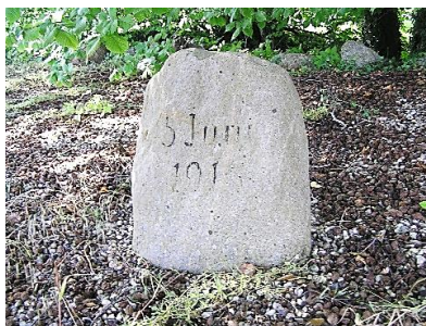
Genforeningsstenen i Rolfsted