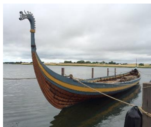
Ladbydragen, kopi af Ladbyskibet.